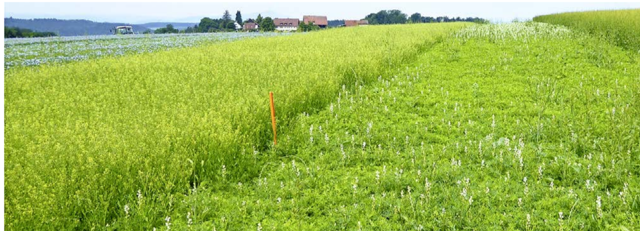
Linsen in Mischkultur: rechts die grüne «Anicia» mit Lupinen, links die kleine schwarze «Beluga» mit Leindotter.

Im zweiten Teil über spezielle Ackerkulturen werden die Anbauerfahrungen von diesem Jahr am Standort Stiegenhof zu Senf, Linsen, Lein und Hirse erzählt.