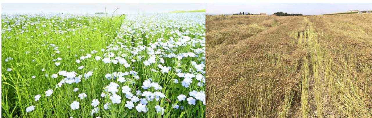
Linsen in Mischkultur: rechts die grüne «Anicia» mit Lupinen, links die kleine schwarze «Beluga» mit Leindotter.

Übrigens können die detaillierten Anbaudaten aller Versuche sowie die aktuellen Versuchspläne auf der Internetseite vom Strickhof unter: http://www.strickhof.ch/fachwissen/biolandbau/biobetrieb-stiegenhof eingesehen werden. ■ Felix Zingg, Strickhof