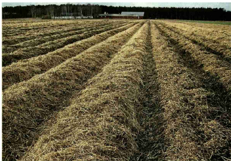
Die Strohabdeckung bei Erdbeeren dient nicht dem Frostschutz, sondern der Verspätung der Ernte. Die Strohecke wird daher erst im Hochwinter (ca. Ende Januar) möglichst bei gefrorenem Boden ausgebracht (Strohmenge 15–20 t/ha). Es lässt sich so eine Ernteverzögerung von rund 14 Tagen erreichen.

Die letzten zwei Wochen war es recht mild und die Erdbeerpflanzen konnten noch weiter Blütenanlagen ausbilden. Doch sobald die Temperaturen auf den Gefrierpunkt sinken, ist es wieder soweit: der Winter ist da, und damit auch Zeit, den passenden Winterschutz für die Erdbeerpflanzen auf dem Feld zu organisieren.