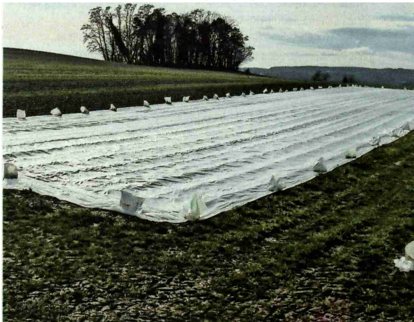
Eine solche Vliesabdeckung der Erdbeeren als Winterschutz ist in den meisten Fällen sinnvoll.