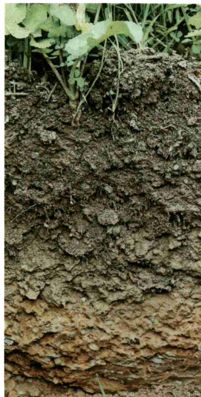
Nicht nur im Unterboden wurde hier eine Verdichtung gefunden. Die Messerprobe zeigte auch einen deutlichen Widerstand im Bereich des Sämaschinen-Horizonts.

Ermutigt und mit vielen praktischen Ideen für die Förderung der Fruchtbarkeit ihrer Böden ausgerüstet, traten die Besucherinnen und Besucher des Bodenfruchtbarkeits-Tags die Heimreise an. ■ Katrin Carrel, Strickhof