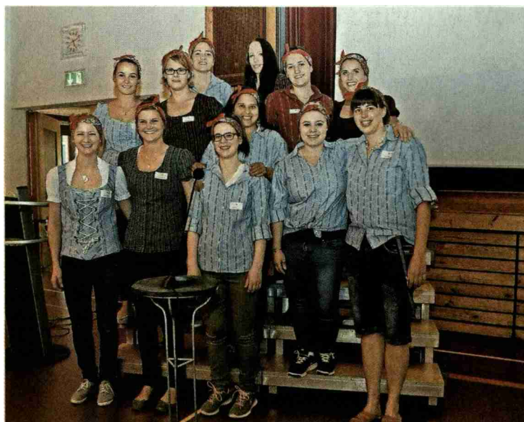
Mit einem selbstgedichteten Lied brachte die Klasse C in verschiedenen Strophen zum Ausdruck, was sie bisher gelernt haben, oder auch nicht. So scheinen nicht alle gleich viel mit grossen Zahlen in der Buchhaltung anfangen zu können.

Referenz: 65405335 Ausschnitt Seite: 4/4