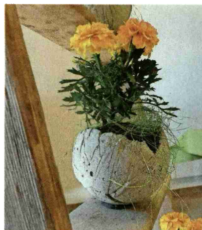
Die Ausstellung zu den Fächern Produktverarbeitung, Ernährung und Verpflegung sowie Werken zog die Blicke auf sich. Hier ein Beispiel einer Dekoration im Beton-Topf.