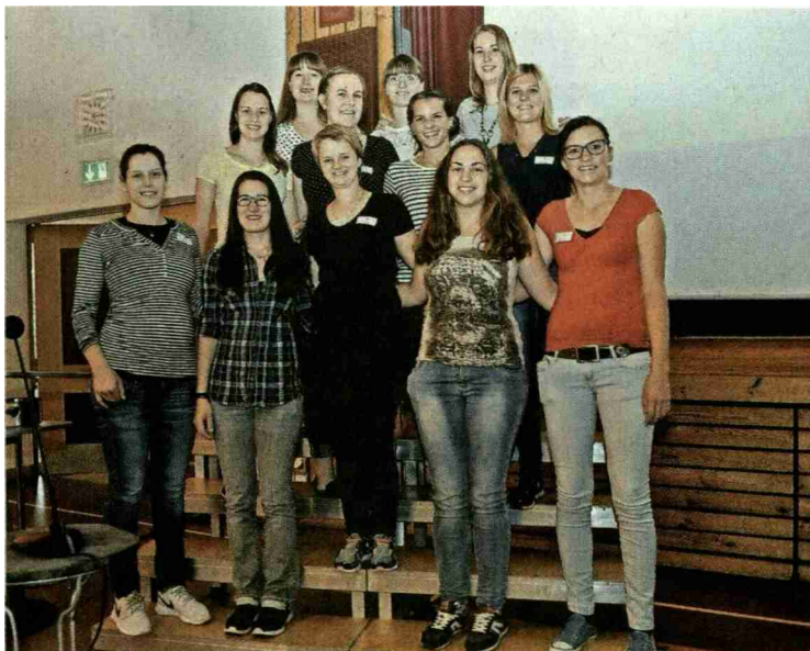
Die Klasse B veranstaltete mit drei Freiwilligen aus dem Publikum ein Quiz mit verschiedenen Fragen zu bereits Erlerntem. Sie demonstrierten anschaulich den Einsatz verschiedener Geräte und Waschmaschinen-Programme.