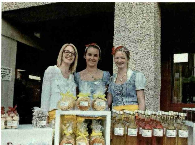
Die Teilnehmerinnen des Wahlmoduls Direktvermarktung boten ihre selbst hergestellten Produkte an. Diese wurden von den Besuchern rege gekauft und auch den Daheimgeblieben als Geschenk mitgebracht.

Referenz: 65405335 Ausschnitt Seite: 2/4