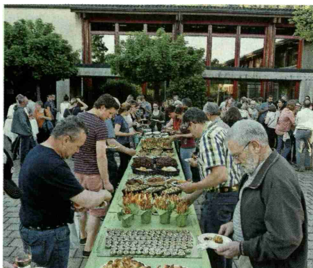
Beim legendären Apéro riche zum Schluss der Veranstaltung wurden 1200 Häppchen – hergestellt von den Teilnehmerinnen – aufgetischt. Das reichhaltige Buffet wurde mit viel Herzblut und Liebe vorbereitet und schmeckte den Besuchern.