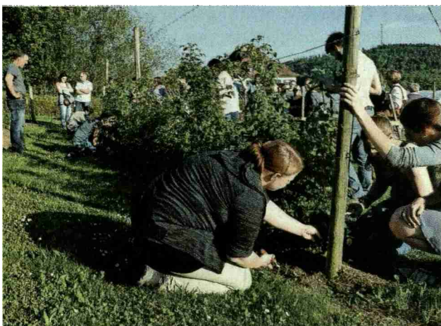
Unter dem Motto «aktuelles im Garten» gingen die Absolventinnen mit Rebscheren bei den Sommerhimbeeren zu Werke. Obwohl der letzte Frost nicht grosse Schäden hinterlassen hat, wurden die Ruten bereits im Hinblick auf das nächste Jahr fachgerecht geschnitten.