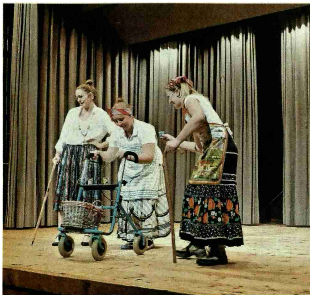
Einblicke in bisher Erlebtes zeigte die Klasse A mit vielen Impressionen in Film und Bild. Angesagt wurde der Beitrag durch drei Absolventinnen, die in 60 Jahren auf ihre Zeit an der Bäuerinnschule zurückblicken.