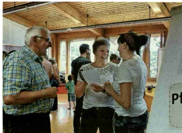
Beim Pfannenquiz konnten die Besucherinnen und Besucher ihr Pfannenwissen testen oder aufbessern. Als Fachfrauen standen die Absolventinnen des Fachkurses Red und Antwort. Für alle gab es ein Schöggeli zu gewinnen.