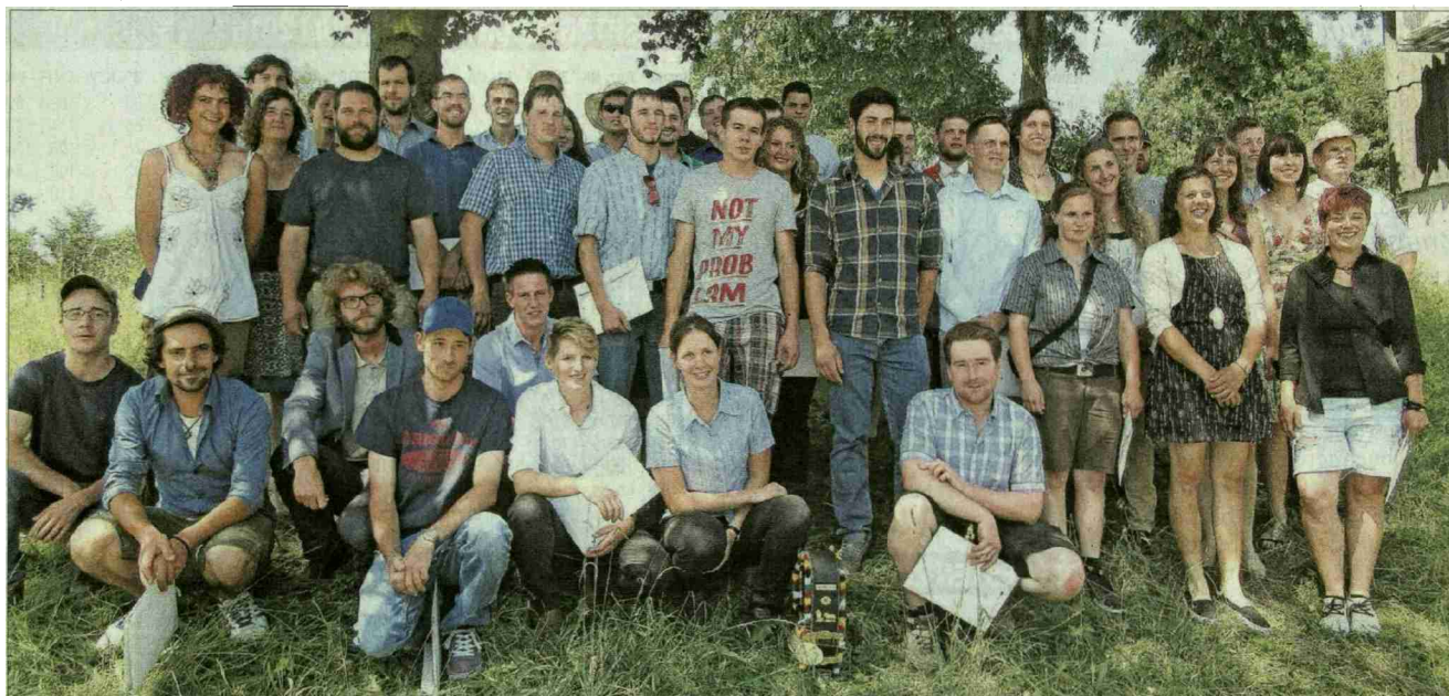
Die anwesenden Absolventinnen und Absolventen der Zweitausbildung. Aufgrund der Arbeitslage auf den Betrieben konnten, wie auch in den anderen Lehrgängen, nicht alle an der Feier teilnehmen.