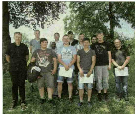
Die Agrarpraktiker freuen sich.