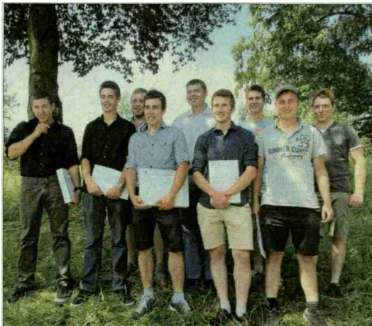
Die frischgebackenen Obstfachleute.

Themen-Nr.: 540.003 Abo-Nr.: 1088177 Seite: 17 Fläche: 86'966 mm 2