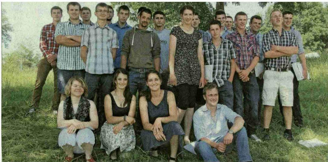
Die neuen Landwirtinnen und Landwirte EFZ Erstausbildung.