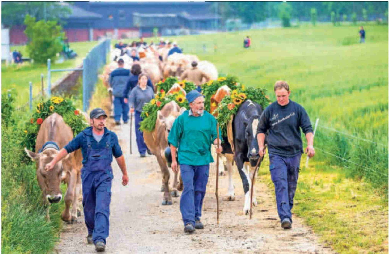
Tierische Züglete zum Nachbarhof: Die Rinder vom Strickhof bekommen für die nächsten 20 Monate ein neues Zuhause.

Themen-Nr.: 540.003 Abo-Nr.: 1088177 Seite: 7 Fläche: 32'902 mm 2