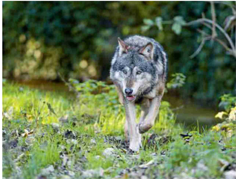
Es ist nicht auszuschliessen, dass im Kanton Zürich wieder einzelne Wölfe auftauchen werden.