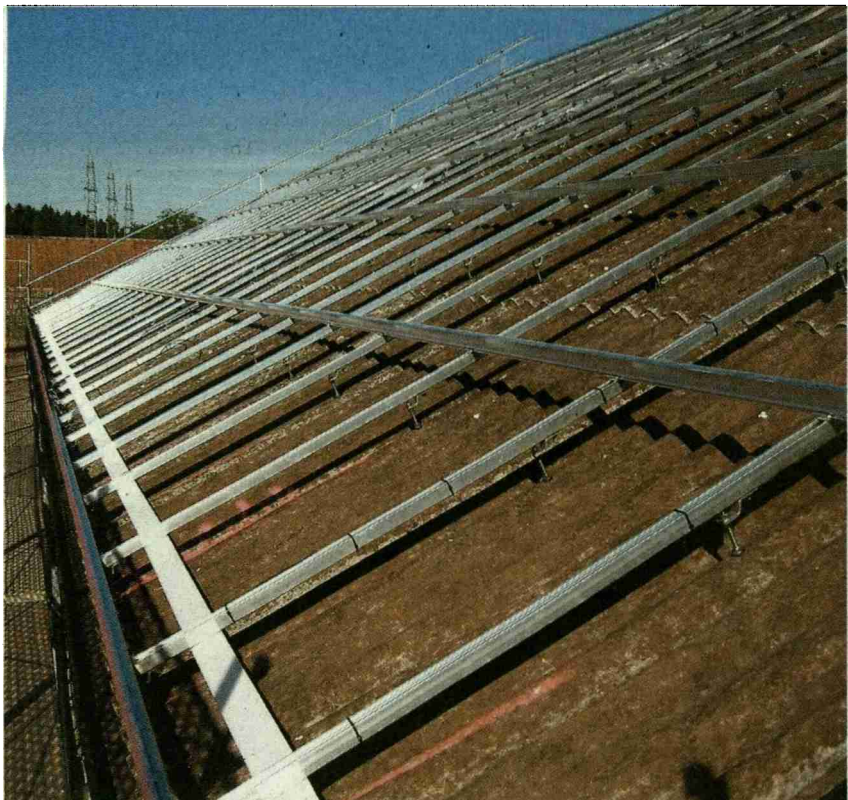
Solaranlage im Bau.