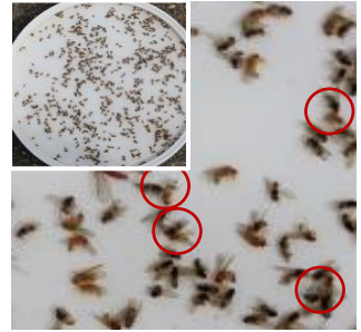
Einfache Bestimmung von ♂