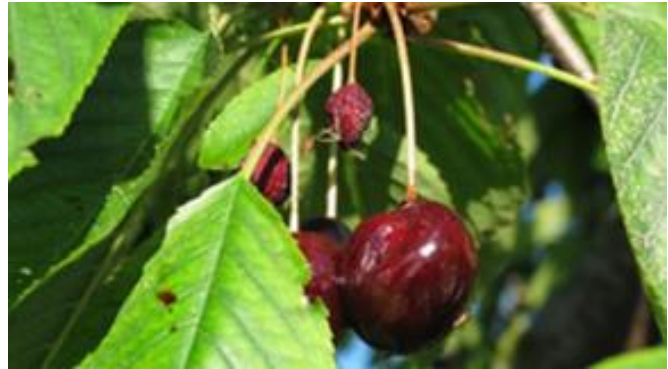
Hängengebliebene Kirschen sind Brutstätten

8. Unternutzen/Mehrfachrückstände: Einige Pflanzenschutzmittel (siehe Allgemeinverfügung und PSMV) haben Auflagen gegenüber von Gewässern, Verfütterung bei Vieh und sind bienengiftig. Die Einhaltung der Auflagen der Mehrfachrückstände kann nicht garantiert werden.