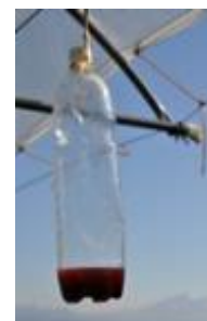
Überwachung: Riga Becherfalle, Profatec-Falle, PET-Falle mit 3 mm Löchern

5. Brennobst: Bei befallenen Brennkirschen und -zwetschgen das Brenngut möglichst gleichentags in die Brennerei abliefern. Frühzeitige Kontaktaufnahme mit der Brennerei ist diesbezüglich empfehlenswert. Allenfalls ist ein sofortiges Einmischen und Ansäuern der Früchte empfohlen (Absprache mit Brennerei). Die Maische soll mit einer Mischsäure (Milch- und Phosphorsäure 1:1, 150 – 200 ml/100 kg Maische.) auf den pH-Wert 3.0 angesäuert werden. Unmittelbar nach der Säure-Beigabe und guter Durchmischung muss die Maische mit Reinzuchthefer (Dosierung Faktor 1.5) zügig in Gärung gebracht werden.