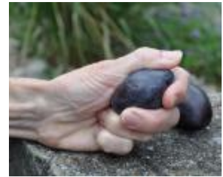
Eiablagen auf Zwetschge und Saftaustritt bei leichtem Druck