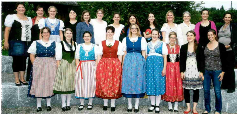
Die Absolventinnen der Fachausbildung Bäuerin, Klasse «berufsbegleitend».

Über 250 Gäste gratulierten an der Schlussfeier vom 11. Juli 2014 den 47 Absolventinnen der Strickhof-Fachausbildung Bäuerin zu ihrem Erfolg.