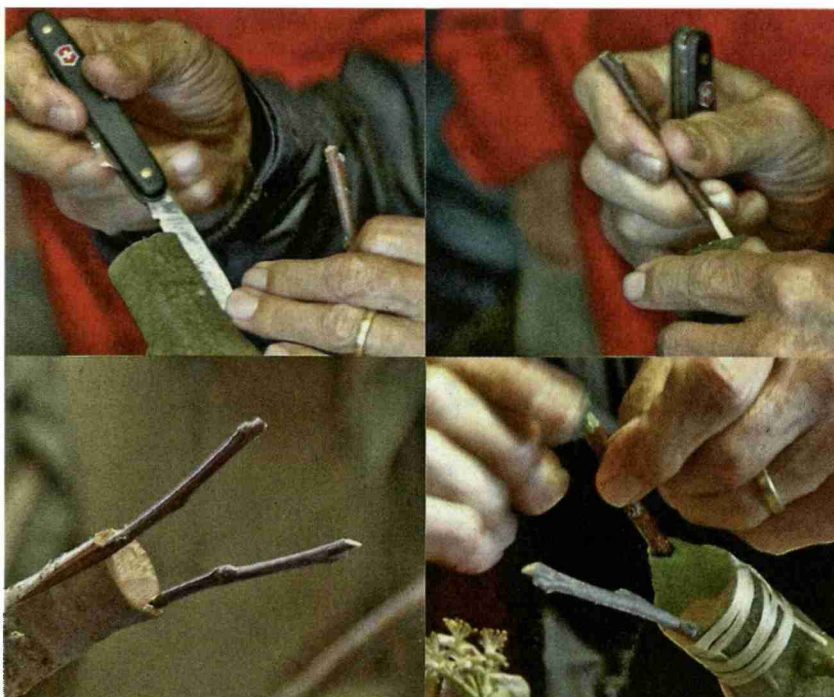
An dickeren Pfropfköpfen werden in der Regel mehrere Edelreiser eingefügt, um die schnellere Wundheilung zu fördern.

Ab Juni können die ersten Austriebe, welche die Edelreiser konkurrieren, entfernt werden. Auch Zug-Äste können zu diesem Zeitpunkt etwas gekürzt werden. In den folgenden Jahren werden je nach Baumgrösse schrittweise die Zug-Äste und alle Triebe und Äste der alten Sorte entfernt. Bei Hochstammbäumen mit Erziehung als Rundkrone werden der Mitteltrieb und die Fortsetzungen der Leitäste angeschnitten. Die übrigen Edelreiser am Pfropfkopf werden eingekürzt, jedoch so lange belassen, bis die gesamte Wunde am Pfropfkopf überwältigt ist.