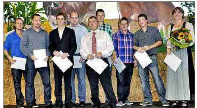
Die Gruppe vom Strickhof.