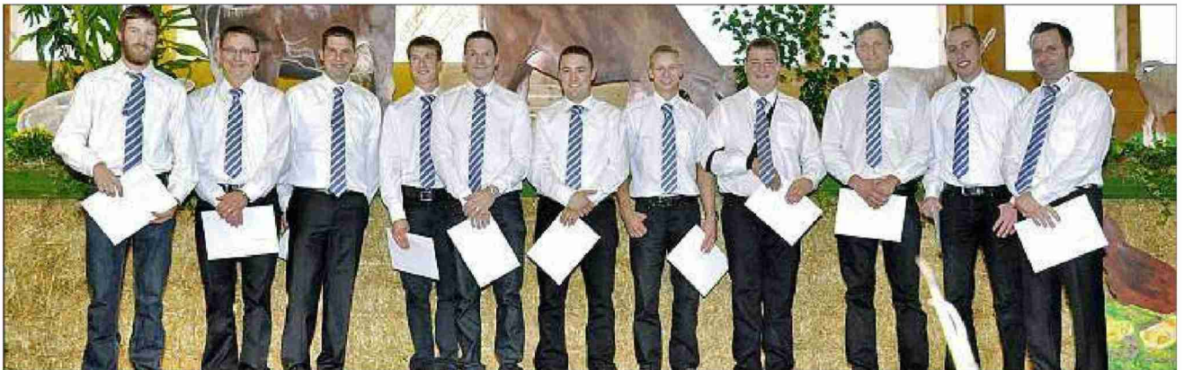
Die Absolventen der BBZN Hohenrain und Schüpfheim.