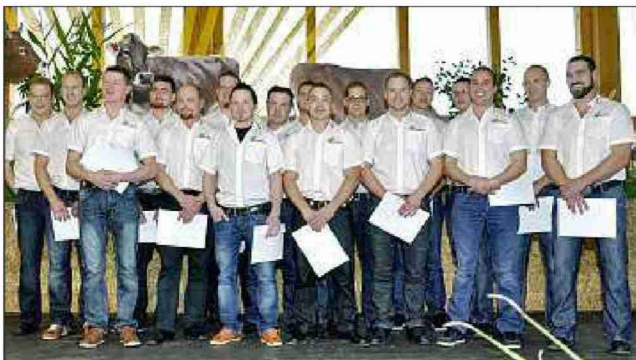
Die Gruppe vom BZ Wallierhof.