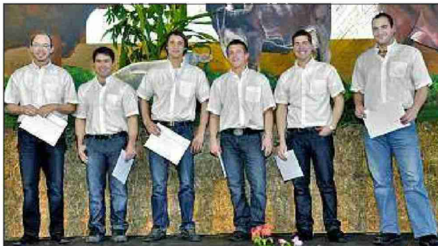
Die Gruppe vom Landwirtschaftlichen Zentrum Liebegg.