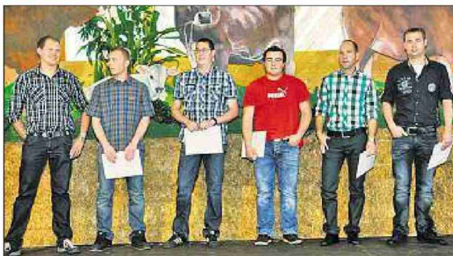
Absolventen vom bzb Rheinhof.