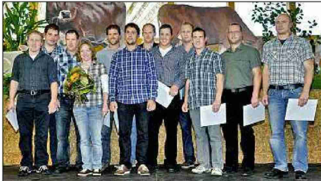
Die Meisterlandwirte vom LBBZ Schluethof.

Themen-Nr.: 540.3 Abo-Nr.: 1088177 Seite: 19 Fläche: 109'745 mm 2