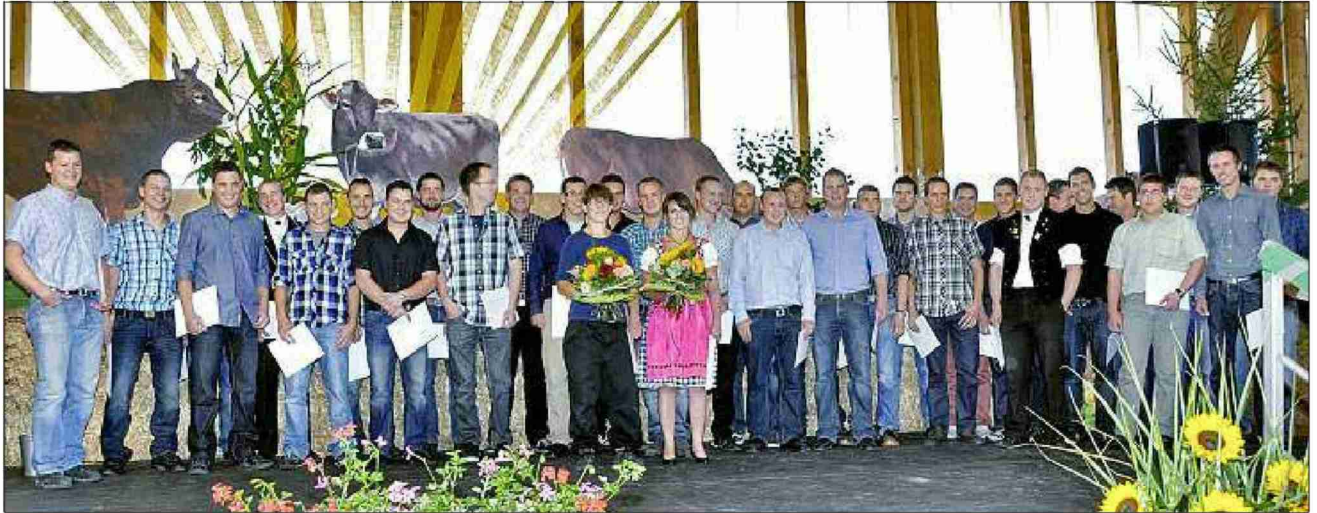
Über ein Viertel der Meisterdiplomanden schloss im Kanton Bern am Inforama ab.

Themen-Nr.: 540.3 Abo-Nr.: 1088177 Seite: 19 Fläche: 109'745 mm 2