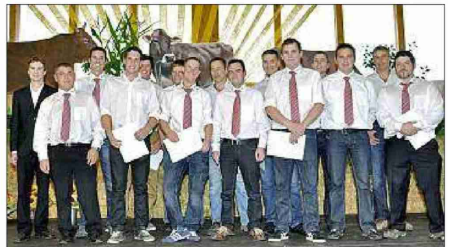
Die Diplomanden vom BBZ Arenenberg.