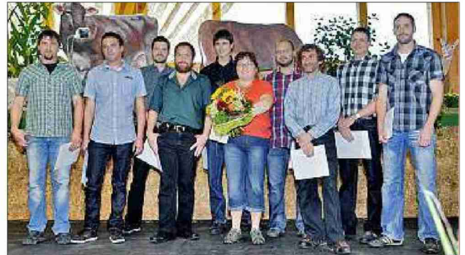
Die Gruppe vom LBBZ Plantahof.