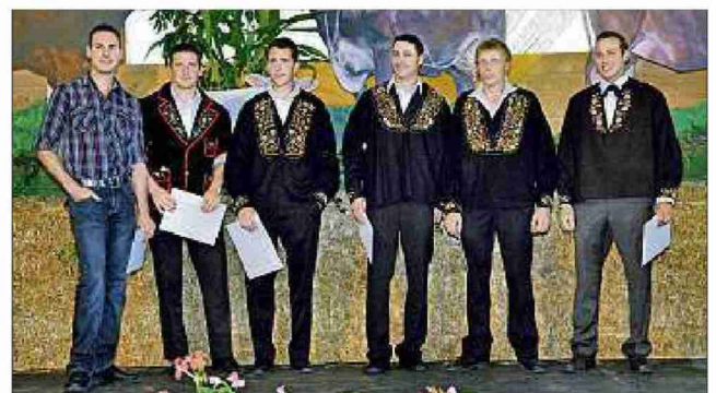
Meisterlandwirte vom BBZ Pfäffikon.