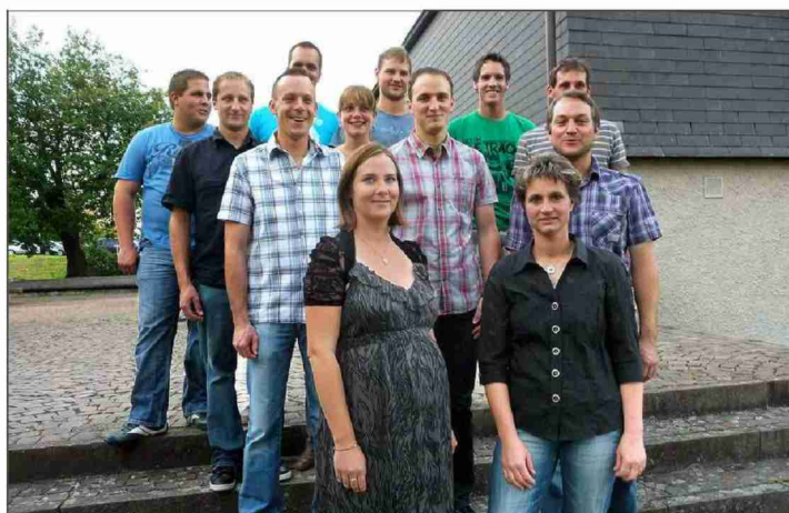
Landwirtinnen und Landwirte mit Fachausweis.