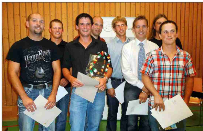
Die Meisterlandwirte wurden nochmals geehrt.

Themen-Nr.: 540.3 Abo-Nr.: 1088177 Seite: 6 Fläche: 37,380 mm 2