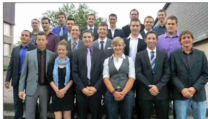
Die neuen Agrartechniker.