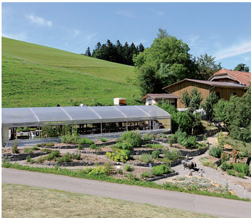
Kräutergarten der Familie Theiler

Auf unserem Ausflug ins Entlebuch werden wir unsere Sinne verwöhnen. An Kräutern schnuppern und feine Brände degustieren. Auch wenn dies nur ein kleiner Teil des vielfältigen Entlebuchs ist, erfahren wir hoffentlich viel Neues und dürfen einen geselligen Tag zusammen verbringen.